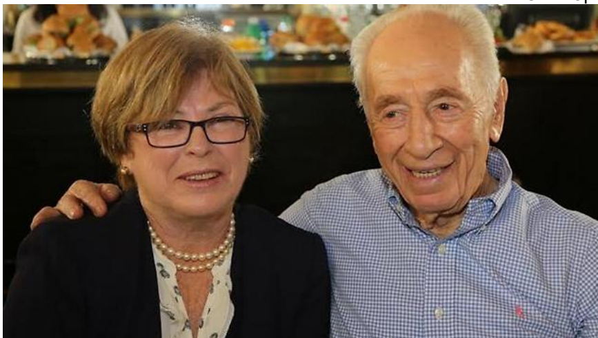
שמעון פרס ומקסין פסברג

הרבה אירועים התרחשו בכנס DLD, במתחם התחנה בתל אביב: הנשיא לשעבר, שמעון פרס, הגיע לכנס. פרס ביקר בביתן של חברת אינטל, ותפס שיחה צפופה עם המנכ"לית, מקסין פסברג. פסברג סיפקה לו, בין היתר, עובדות מספריות, כמו העובדה שאינטל היא המעסיק הפרטי הגדול במשק עם 10000 עובדים, וגם את העובדה, שאינטל היא המעסיק הגדול ביותר של ערבים-ישראלים בהייטק. פרס הקשיב והפנים.