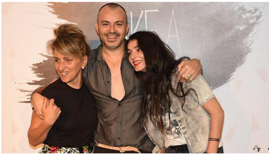
שלושת הסטייליסטים