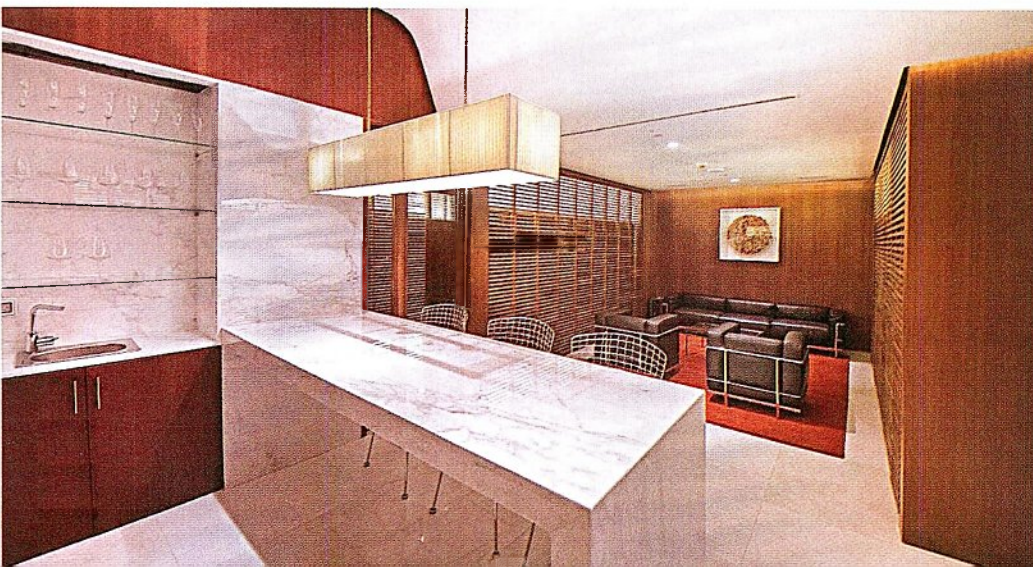
מרתף יינות במגדל Meier on Rothschild